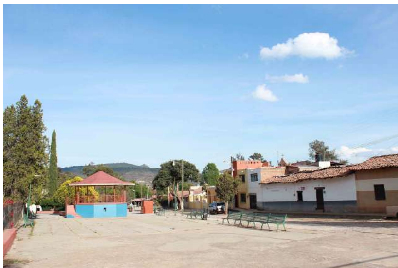
Figura 2. Centro de Palo Alto.

Cuentan los lugareños que Palo Alto nació como un pueblo minero, pero la mina se agotó y la gente se dispersó, dejando la hacienda en el abandono. Pasado un tiempo, fue adquirida por particulares que la convirtieron en huertos de naranjo. Así se reactivó la vida económica para los que se habían quedado ya que hubo oportunidades de trabajo en la granja. Posteriormente, los terrenos pasaron a ser parte del ejido y dieron forma a la comunidad que habitan actualmente (figura 2).