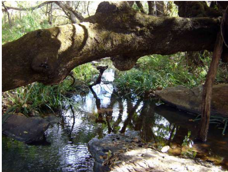
Figura 4. La Ciénega.

En cuanto a las especies documentadas en riesgo están: el tigrillo ( Leopardus pardalis ), el jaguar ( Panthera onca ), jaguarundi, leoncillo ( Puma yagouaroundi ), halcón peregrino ( Falco peregrinus ), murciélago trompudo ( Choeronycteris mexicana ), tuza de Jalisco ( Pappogeomys bulleri alcorni ), zorzal mexicano ( Catharus occidentalis ), orquídea malaxis tepicana ( Malaxis tepicana ), lagartija espinosa del Pacífico ( Sceloporus horridus ), entre otros (Sistema de Información, Monitoreo y Evaluación para la Conservación, 2017). En relación con el contexto ecológico, se hace mención de que la presencia de las especies señaladas es muy importante tanto ecológica como económicamente al ser parte de las cadenas tróficas y para el autoconsumo.