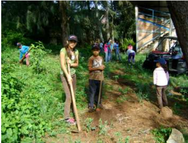
Figura 6. Brigadas de reforestación.

Otros entrevistados, adultos que han pasado más de cincuenta años en la localidad, ven el crecimiento en el número de casas y la tala de árboles que esto ocasiona. La extracción de leña aún se practica para uso doméstico y comercial, aunque ya son pocos los terrenos ejidales que tienen árboles para derribar. Llama la atención que a pesar de que algunos relacionan la escasez de árboles con los cambios hidrológicos del lugar, esta conciencia no basta para que se adopten prácticas de desarrollo más sustentables. Sin embargo, existen esfuerzos de la comunidad por mantener la naturaleza del lugar, como ejemplos: la creación de un área protegida en los linderos de Palo Alto, designada por las personas de la localidad; las brigadas de reforestación en los meses de julio y agosto, antes de las épocas de lluvia (figura 6); así como las campañas de limpieza en áreas comunes como la plaza, las calles y el cementerio.