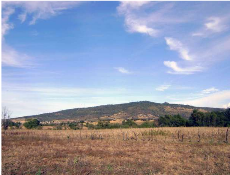
Figura 7. Uso del suelo. Figura 6. Brigadas de reforestación.

Cuando se habla de crear zonas de bosque y reforestar lotes en el ejido, según el testimonio de una entrevistada existe el problema de que todos los lotes están ocupados con alguna actividad agropecuaria, lo que se puede apreciar en el mapa de uso de suelo de la localidad. Gracias a la fotografía aérea y al testimonio de la gente es posible identificar que las parcelas ejidales se dedican al cultivo de maíz y a la cría de ganado bovino principalmente (figura 7).