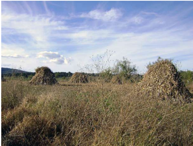
Figura 5. Actividad agrícola.

Según lo observado y por testimonios de los entrevistados, el número de coches ha aumentado en la localidad, al igual que el uso de motocicletas para montaña. Entre las fuentes de impacto biológico se encuentran la introducción de la tilapia del Nilo en algunos bordos del ejido y árboles de eucalipto; esta especie de flora fue introducida hace tiempo y paradójicamente se plantaron junto a los depósitos de agua, lo que ocasionó un daño por ser gran consumidora de este recurso.