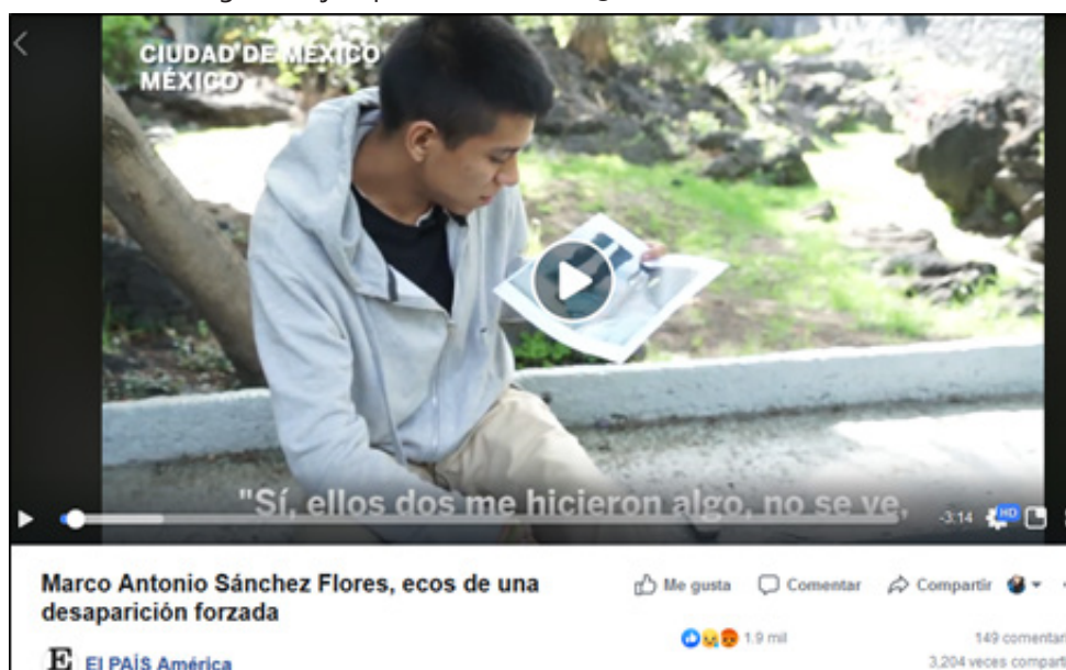
Imagen 1. Ejemplo del reactivo 25 en el cuestionario