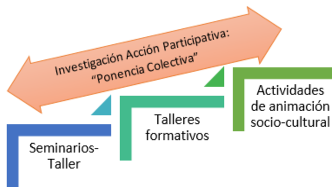
Gráfico 3. Propuesta metodológica del Diplomado en Posconflicto

Para garantizar el ejercicio pedagógico propuesto, a nivel metodológico, el diplomado se estructuró a partir de tres tipos de actividades, y un componente transversal (ver gráfico 3). El proceso se condujo, tal como lo propone Paulo Freire (1990), a un momentum de autoreflexión crítica sobre el tiempo y el espacio que nos ha tocado vivir, para insertarnos en la historia como autores y actores, y no meramente como espectadores.