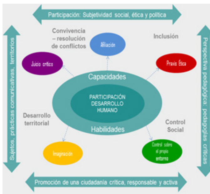
Gráfico 1. Sistema de Formación Ciudadana para la Participación